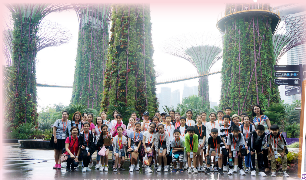
暢遊濱海灣花園，了解當地的綠色建築設計。