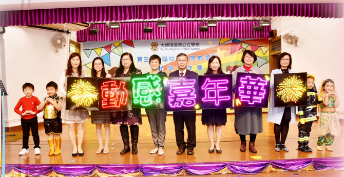
亮燈儀式，揭開序幕。