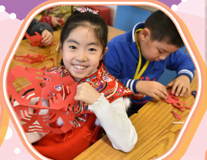
一同學習中國剪紙藝術