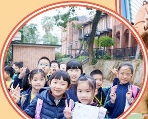
實地考察，了解理民府的英式建築