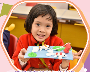
同學用麵粉製作的金魚真是栩栩如生！

當日活動內容豐富，有親子麵粉公仔製作、中樂表演、賀年食品製作及各式攤位等，氣氛熱鬧非常！課室內亦安排不同的賀年手工藝創作，同學投入參與，享受其中。