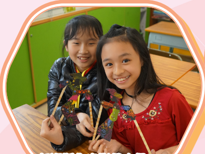
初次製作皮影戲人偶，樂趣極了！