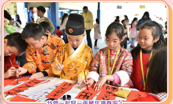
我們一起寫一張豬年揮春吧！