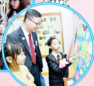
學生學習成果展示