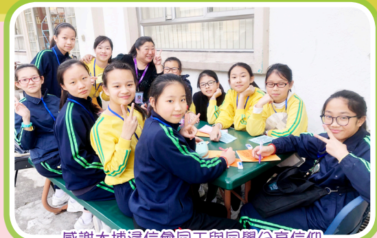
感謝大埔浸信會同工與同學分享信仰