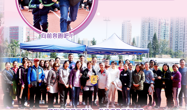
感謝家長義工幫忙，令校運會順利完成。