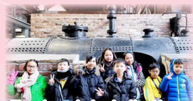
The steam trains in the Museum of Science and Industry