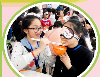
在奧比斯蒙眼午餐中體會「看得見」的幸福