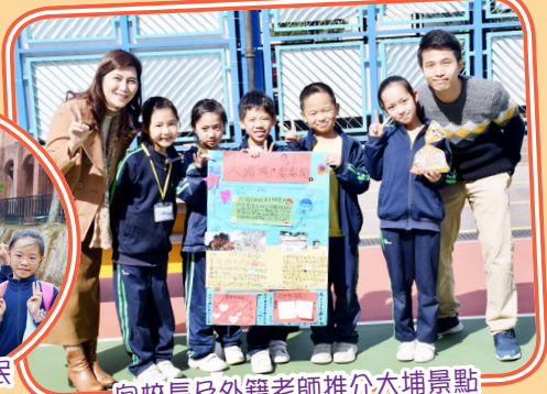
向校長及外籍老師推介大埔景點