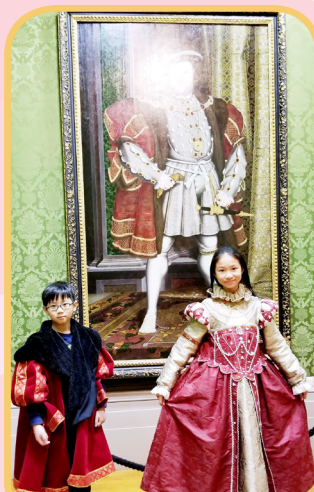
Dressing up as kings and queens in the Walker Art Gallery