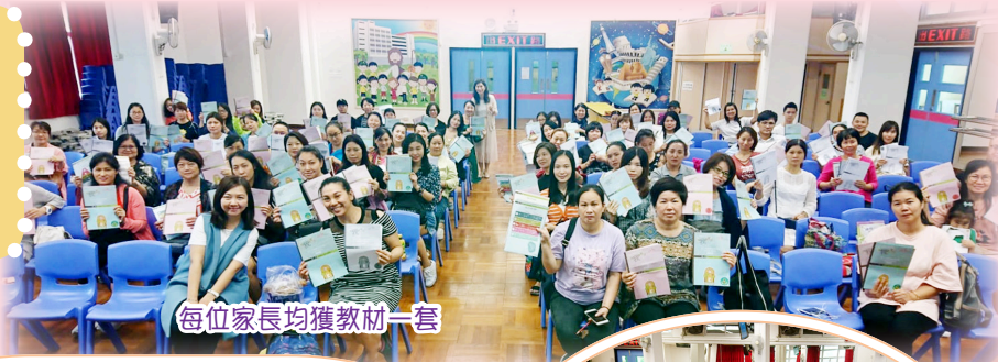
每位家長均獲教材一套

自10月起，本校邀請「生活教育活動計劃」的團隊舉辦八節「新一代健康成長錦囊」家長教育課程。課程有效增強家長在親子溝通及管教方面的技巧及信心，了解子女成長需要。