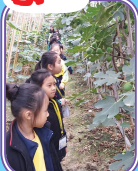
細心觀察水果的生長環境