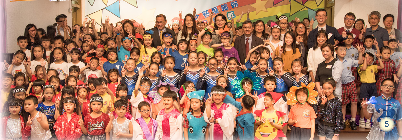
大埔浸信會公立學校 Tai Po Baptist Public School