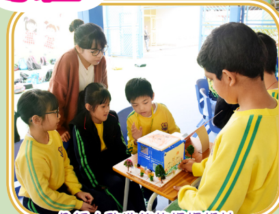
介紹大改造後的操場設計