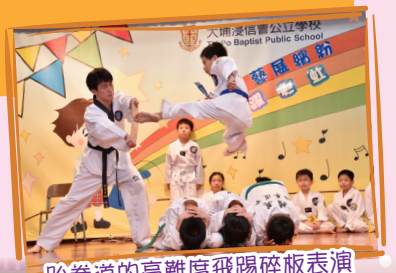
跆拳道的高難度飛踢碎板表演