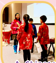
A Chinese New Year presentation to the Lord Mayor of Liverpool!