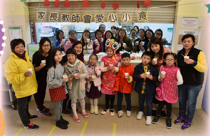
感謝家長義工為師生準備美味的湯圓。