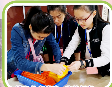
同心合力洗碗，收拾餐桌。