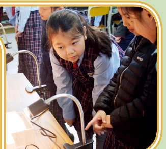
測試不同物料的耐熱度