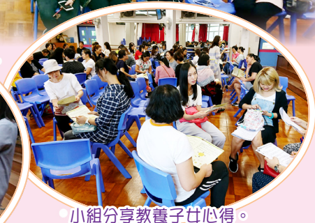
小組分享教養子女心得。