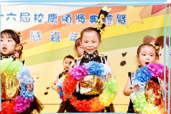
幼稚園學生舞姿輕盈...令活動錦上添花。

2019年1月12日，36周年校慶頒獎典禮暨動感嘉年華隆重舉行了。當天除了頒發「親子背包設計比賽」的獎項外，更邀請了友校幼稚園學生、本校花式跳繩隊及手鐘隊作出精彩的表演。嘉年華更設有不同攤位遊戲及展覽，展出同學豐盛的學習成果，盡現埔浸小多元化的發展。