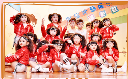
小一舞蹈組學員在台上載歌載舞