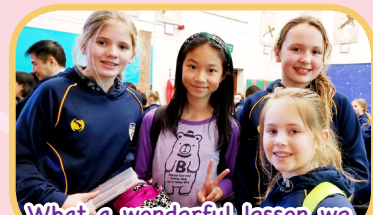
What a wonderful lesson we had with the local students at St Edward's Primary School!