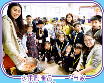
水果副產品——「自家製果醬」出爐