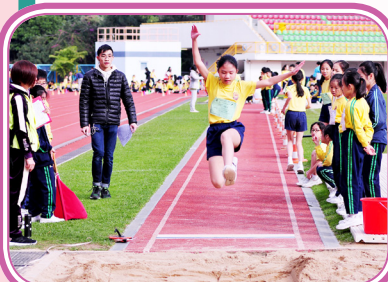
突破自己，跳得更遠！

校運會是發揮同學堅毅和團隊合作的好機會。當日一眾健兒積極投入賽事，全力以赴，更學到「勝不驕，敗不餒」的精神！