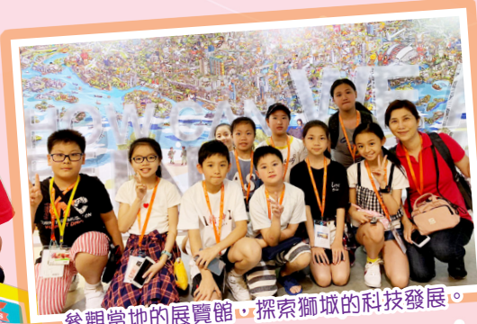
參觀當地的展覽館，探索獅城的科技發展。