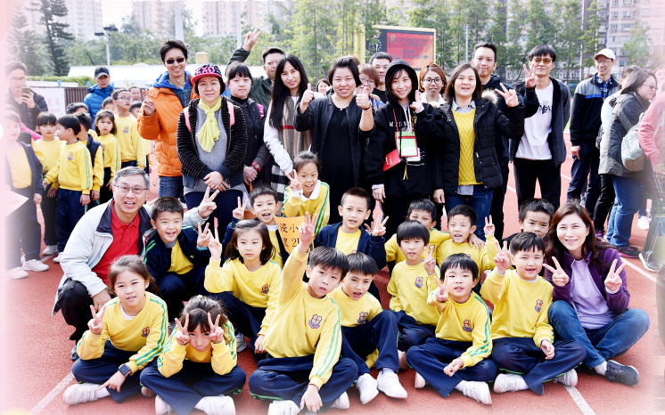
初小遊戲競技，透過遊戲享受親子同樂。