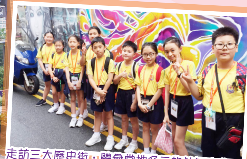
走訪三大歷史街，體會當地多元的社區文化。