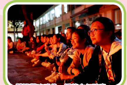
體驗營火晚會，回憶六年時光。