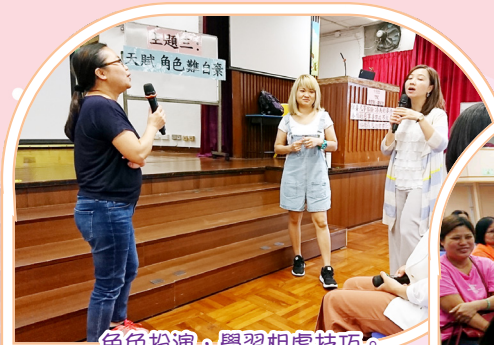
角色扮演·學習相處技巧。