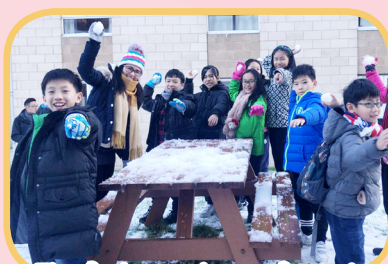
The first experience of snow!