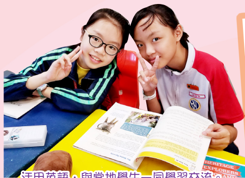
活用英語，與當地學生一同學習交流。