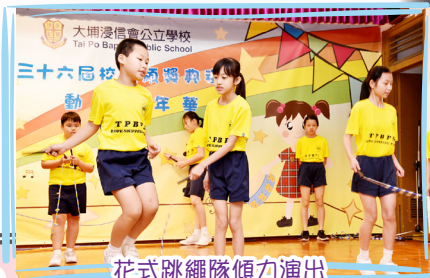
花式跳繩隊傾力演出