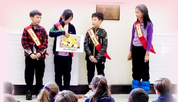
Cultural sharing in Runcy Mede St Edward's School