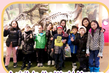
A visit to the World Museum