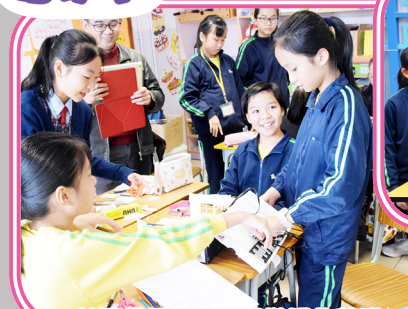
共同構思改造校園裝置的藍圖