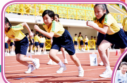
健兒們悉力以赴，大顯身手。