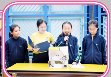
介紹及試驗自動化裝置的模型設計