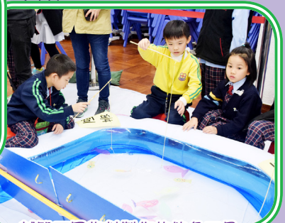
試驗不同物料製作的釣魚工具