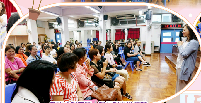
課程內容充實·家長都專心聽講。