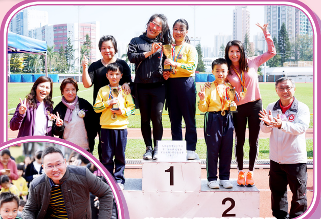
恭喜所有得獎家長及同學