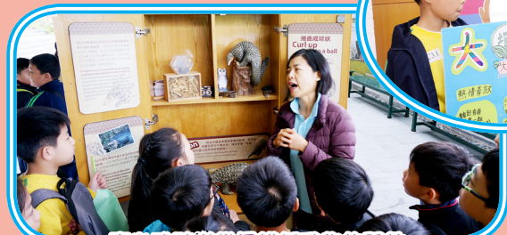
專心聆聽導賞員講解動物的習性