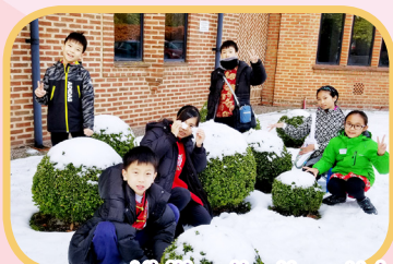
Visiting the Hope University! Do we look cool?