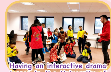
Having an interactive drama lesson in the University of Liverpool